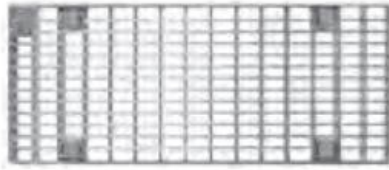
Cinkuoto/nerudijančio plieno tinklinės grotelės