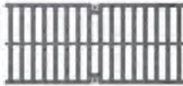
Kalaus ketaus tarpinės grotelės