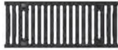
Kalaus ketaus tarpinės grotelės