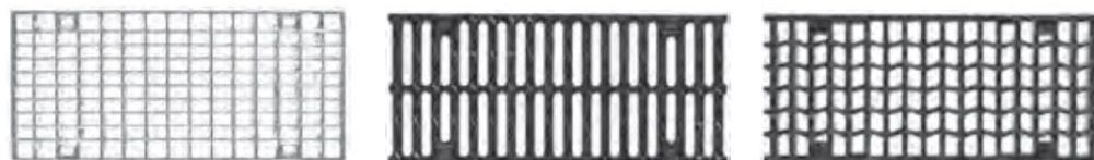
Tinklinės, cinkuoto plieno gr. Tarpinės, kaliaus ketaus gr. Banguotos, kaliaus ketaus gr.