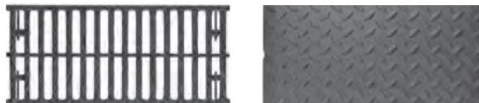
Tarpinės, kaliaus ketaus grotelės Uždaros, kaliaus ketaus grotelės